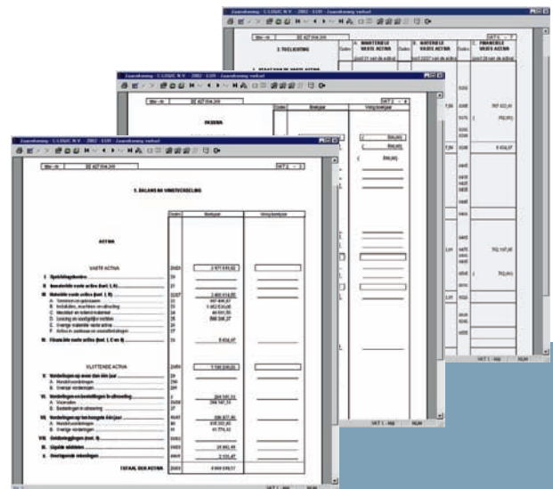
Voor intern gebruik kan de jaarrekening worden afgedrukt ...

Hoewel het de bedoeling is om de jaarrekening elektronisch neer te leggen, is ook in een afdruk voor intern gebruik voorzien. Die afdruk kunt u produceren in eurocenten of in de eenheid waarin de jaarrekening moet worden neergelegd. Ook de saldolijst, de foutenlijst, de afdruk van de ratio's, en een lijst van alle controles (verplichte en bijkomende) waaraan de jaarrekening nog niet voldoet, is beschikbaar.